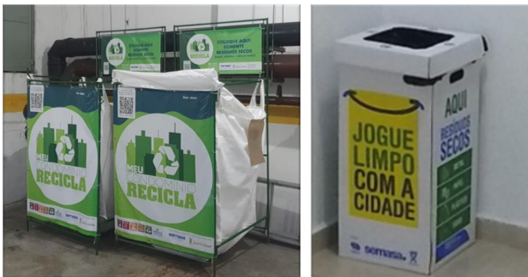
Figura 7: Equipamentos de coleta instalados em condomínio participante do projeto.

demais resíduos úmidos, garantindo assim a destinação qualificada dos mesmos para as cooperativas que atuam na cidade.