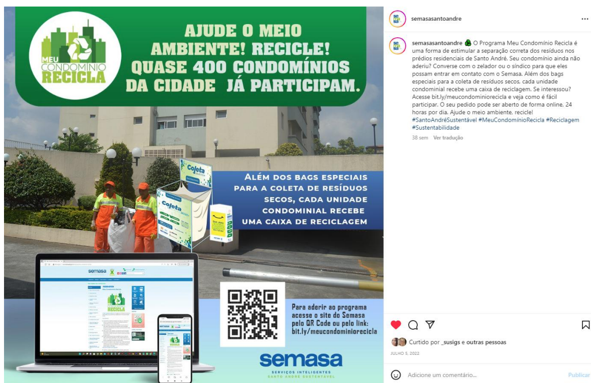
Figura 5: imagem das redes sociais do Semasa divulgando o Meu Condomínio Recicla.

O projeto Meu Condomínio Recicla tem como objetivos reestruturar a coleta seletiva em áreas adensadas por empreendimentos multifamiliares, propiciar maior adesão da população na separação dos resíduos secos e contribuir com a limpeza pública demandada pelo adensamento causado pelo condomínio residencial, além de aumentar a quantidade de resíduos secos enviados para as cooperativas de reciclagem e o crescimento no ganho financeiro dos cooperados a partir do aumento de recicláveis.