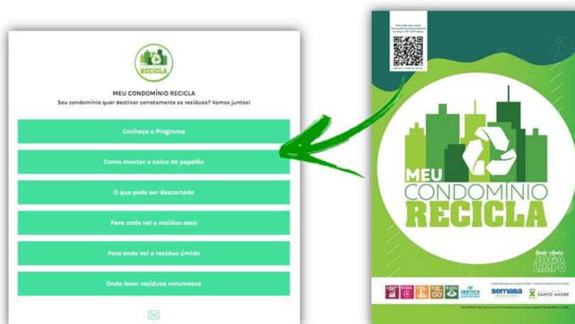
Figura 6: Selo de adesão ao projeto e ilustração do agregador de links direcionado pelo QR Code.

Para a implantação do projeto é utilizada toda estrutura existente da coleta seletiva, adaptando-se os roteiros à medida que acontecem as adesões dos interessados. A inclusão dos condomínios é feita por Manifestação de Interesse, a partir de ampla divulgação do projeto em toda cidade. Após isso, é feita uma vistoria para diagnóstico das condições do abrigo de resíduos, forma de separação, acondicionamento e disponibilização para a coleta. A partir deste momento, o condomínio passa a integrar a relação dos participantes e recebe o selo de adesão ao programa. O selo Meu Condomínio Recicla destaca o condomínio, e também apresenta um QR Code que direciona o morador a um agregador de links com informações relevantes sobre o projeto. Além do agregador de links, também foi criado um endereço de e-mail específico, bem como um número de whatsapp para facilitar a comunicação e interação com o poder público.