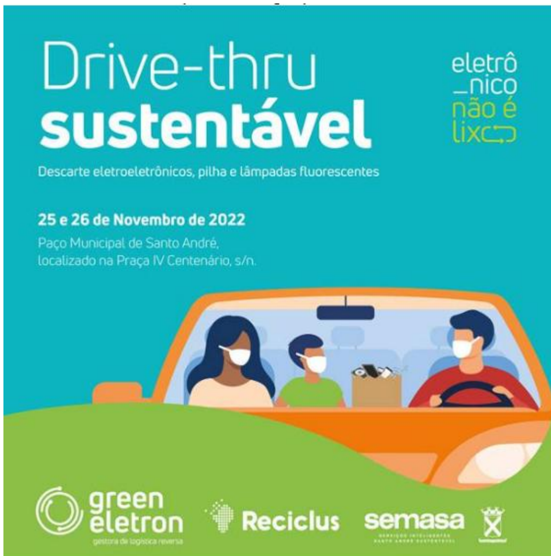
Figura 1: Imagem veiculada via e-mail.