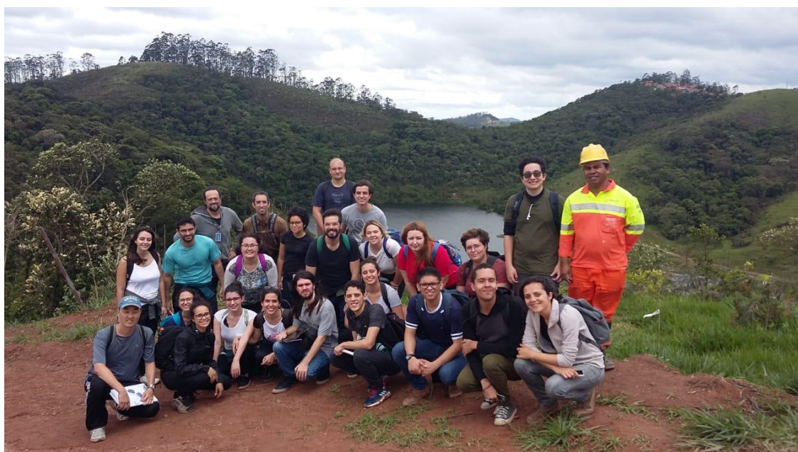
Foto 4: Visita a CTR com alunos e o professores do curso de Bacharelado em Planejamento Territorial da UFABC em outubro de 2018.