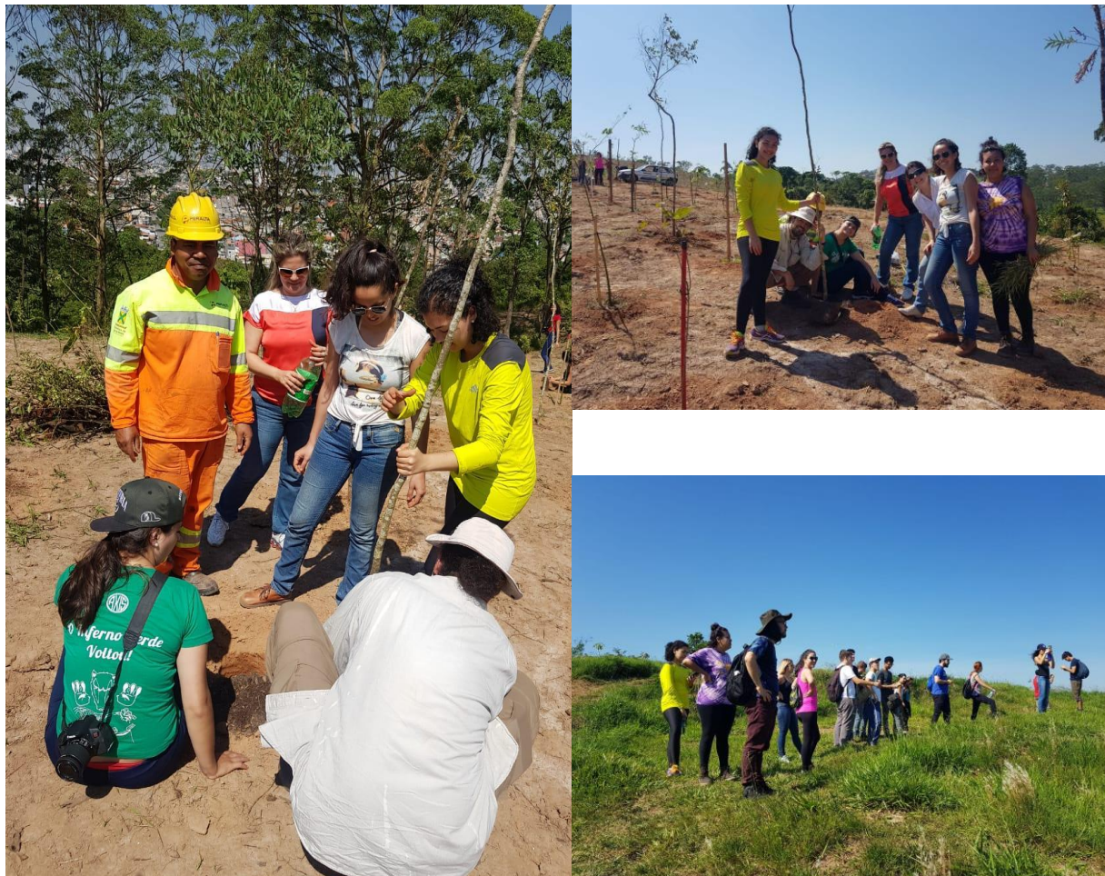
Fotos 2: Mutirão de reflorestamento realizado em 12 de dezembro de 2018 com professores e alunos da EARSU/UFABC.