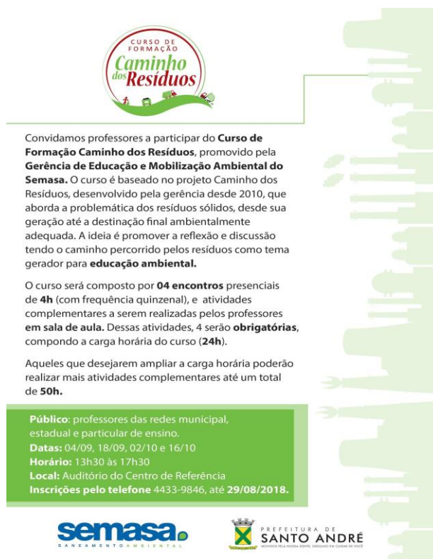
Figura 2: Folder do relançamento do “Caminho dos Resíduos”.

As atividades foram coordenadas e executadas pela GEMA/DGA, que tratam do 3º encontro do Curso de Formação Caminho dos Resíduos aconteceu no dia 02 de outubro, e contou com a presença de 10 participantes. O formato, voltado aos professores da rede municipal, foi distribuído da seguinte maneira: