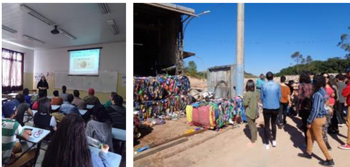
Fotos 1: à esquerda atividades do 1º encontro e, à direita, visita à cooperativas de triagem de resíduos, na CTR, realizado durante o 2º encontro.

Quanto às atividades do 2º Encontro, realizadas em 11 de agosto de 2018 - das 9h00 às 12h00, contou com atividades de exposição realizada no Centro de Referência em Educação Ambiental e, depois, a visita técnica realizada na CTR.