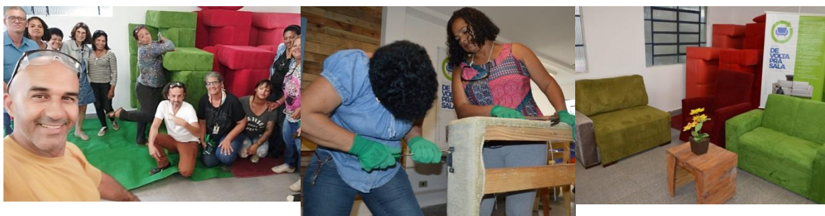
Fotos5: Turma reunida (antes das restrições), oficinas práticas do curso e sofás produzidos.

Neste semestre, aconteceu o aprofundamento das aulas teóricas, nas quais eles puderam aprender as diversas técnicas empregadas para a construção de um sofá. Diante das restrições impostas pela pandemia, as atividades presenciais foram interrompidas no dia 13 de março de 2020 até que haja liberação pelas autoridades considerando o novo contexto. A seguir, apresentamos algumas fotos dos encontros.