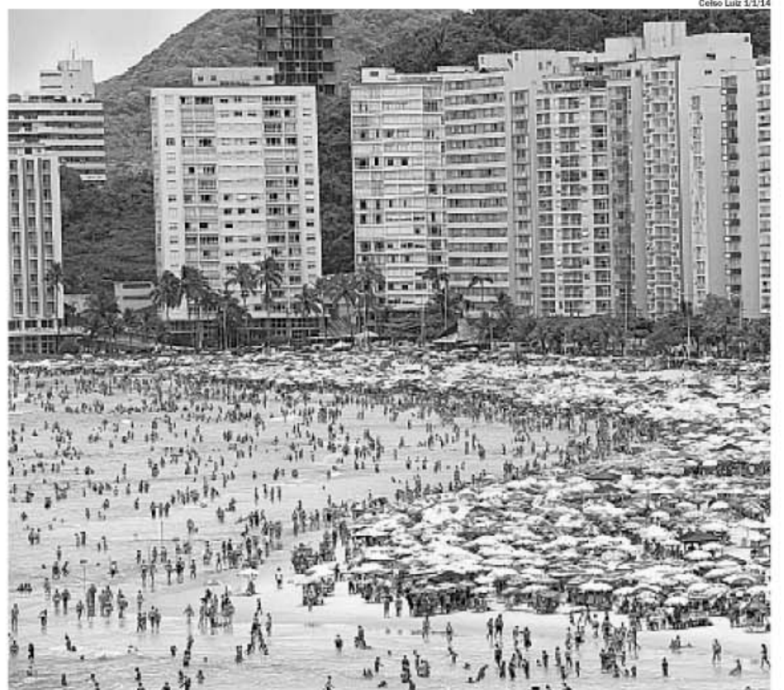
PRÓXIMO. Dentro do grupo que conseguiu viajar, 69% tinham a intenção de não sair do próprio Estado